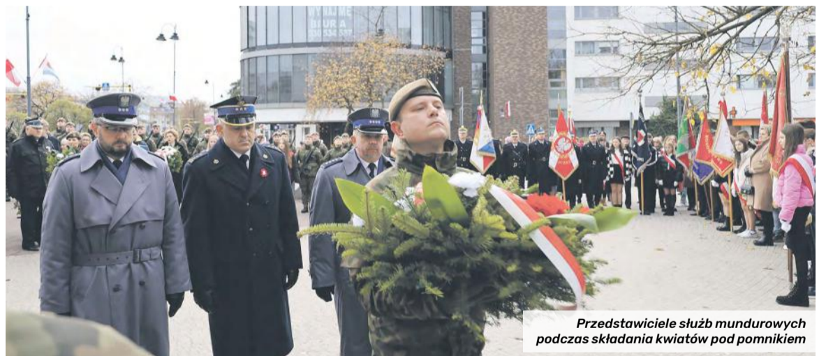
Przedstawiciele służb mundurowych podczas składania kwiatów pod pomnikiem