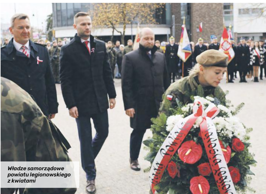
Władze samorządowe powiatu legionowskiego z kwiatami