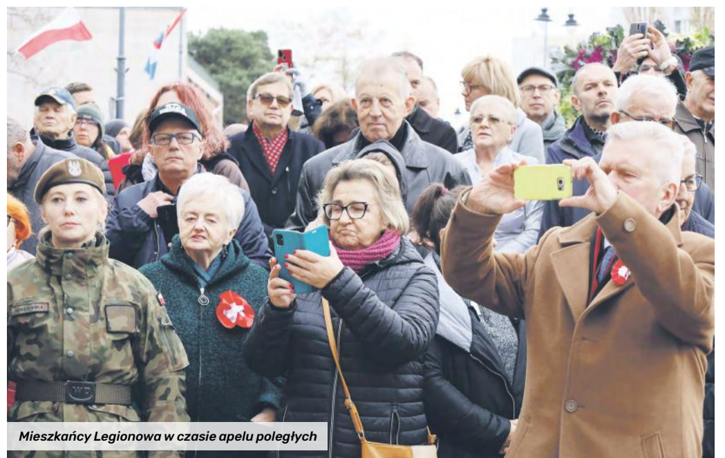
Mieszkańcy Legionowa w czasie apelu poległych