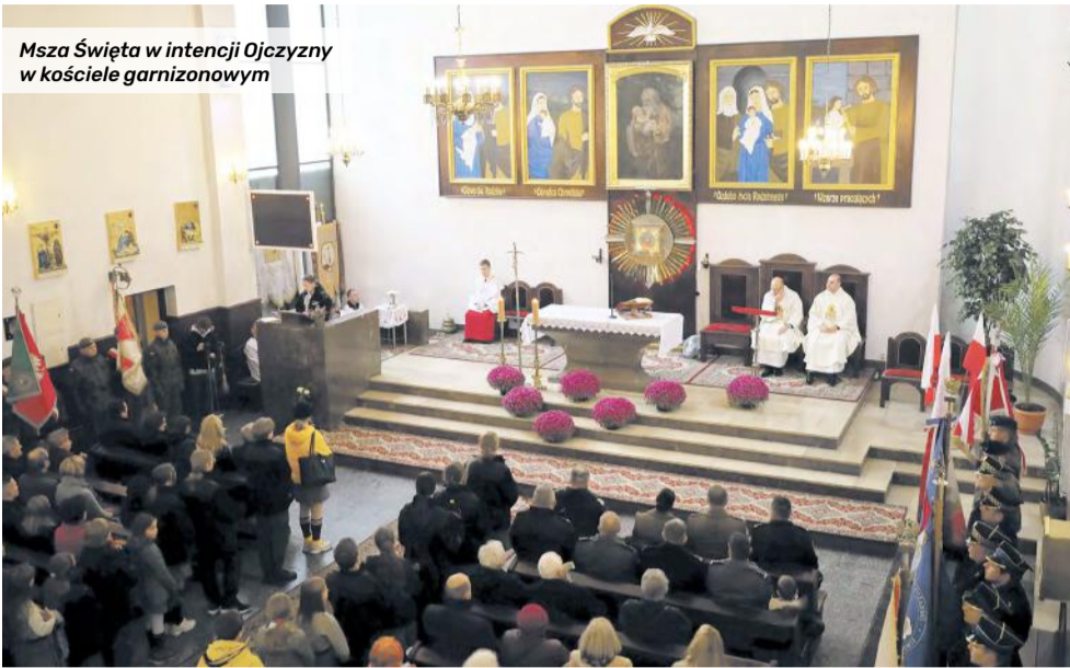
Msza Święta w intencji Ojczyzny w kościele garnizonowym