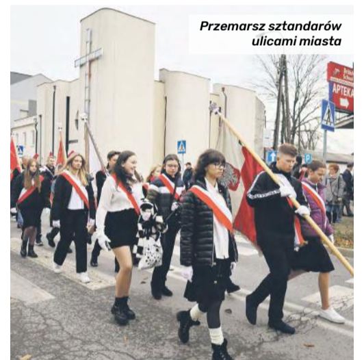
Przemarsz sztandarów ulicami miasta