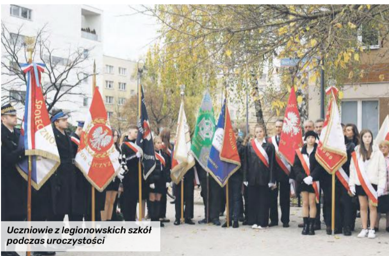
Uczniowie z legionowskich szkół podczas uroczystości