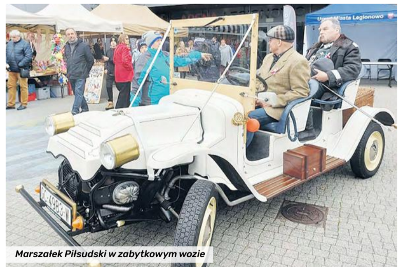
Marszałek Piłsudski w zabytkowym wozie