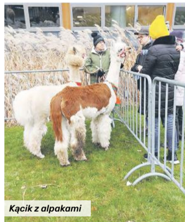
Kącik z alpaki