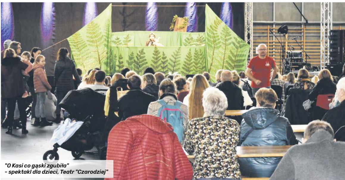
"O Kasi co gąski zgubiła" - spektakl dla dzieci, Teatr "Czarodziej"