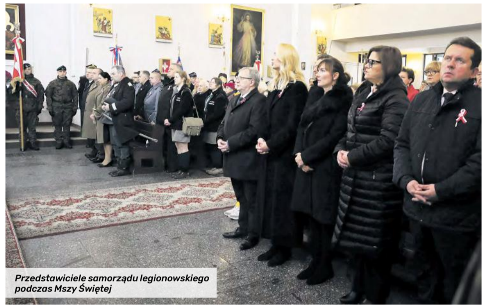
Przedstawiciele samorządu legionowskiego podczas Mszy Świętej