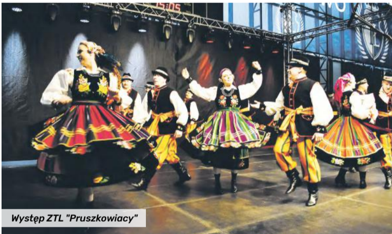
Występ ZTL "Pruszkowiaczy"