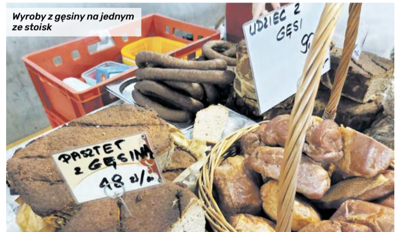
Wyroby z gęsiny na jednym ze stoisk