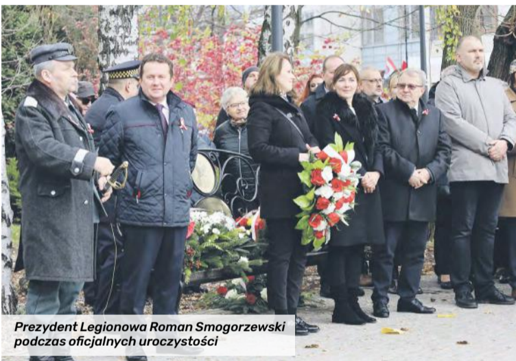
Prezydent Legionowa Roman Smogorzewski podczas oficjalnych uroczystości