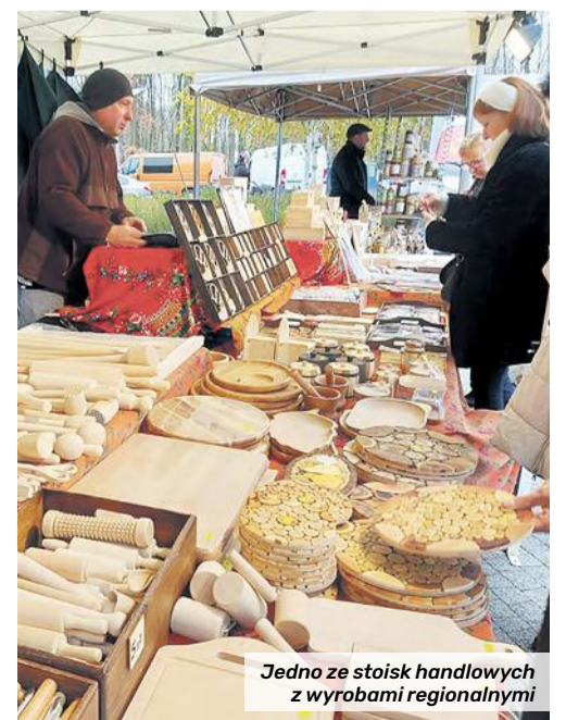
Jedno ze stoisk handlowych z wyrobami regionalnymi