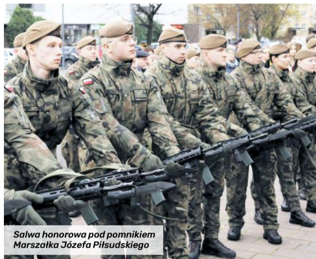
Salwa honorowa pod pomnikiem Marszałka Józefa Piłsudskiego