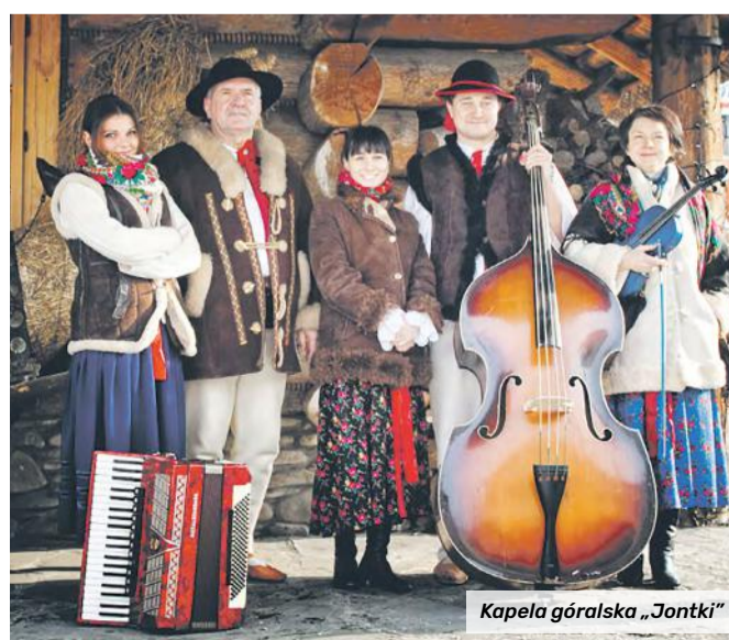
Kapela góralska „Jontki”