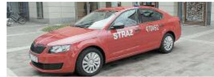
Legionowo od lat wspiera Straż Pożarną

Legionowo i starostwo zobowiązały się przeznaczyć 12 tys zł na jego zakup, pozostałe gminy po 5 tys zł. – Zapadła decyzja o wspólnym zakupie fantoma, ponieważ będzie on wykorzystywany z korzyścią dla