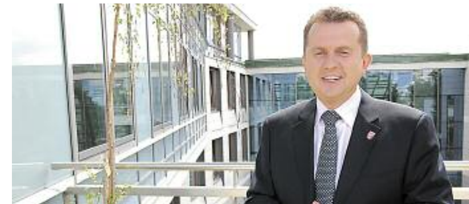
PKP nie chciało inwestować w Legionowie