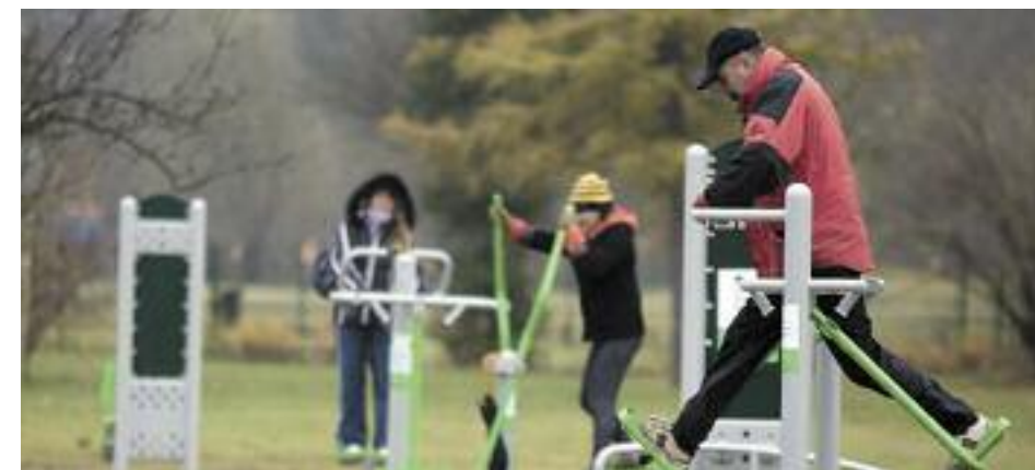
Tężnia, siłownia i ścieżki zdrowia wkrótce powstaną przy Arenie

Podczas konsultacji społecznych mieszkańcy z aprobatą odnieśli się do pomysłu, że na tere-