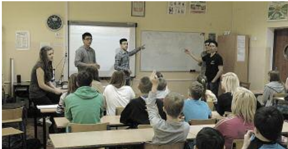
Uczniowie legionowskiej szkoły wymienili doświadczenia z kolegami z zagranicy

W połowie lutego przez kilka dni studenci z Brazylii, Iranu i RPA zrzeczeni w międzynarodowej organizacji studenckiej AIESEC byli gośćmi w legionowskiej Trójce. Na spotkaniach z nimi uczniowie tej szkoły m.in. szlifowali znajomość języka angielskiego.